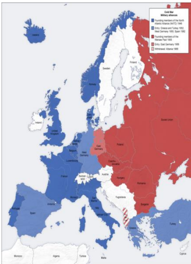
รูปที่ 1 องค์การนาโต (สีน้ำเงิน)

การล่มสลายของสหภาพโซเวียต หนึ่งในสองของอภิมหาอำนาจในโลก เมื่อ พ.ศ.2539 ซึ่งถือเป็นสัญญาณของการสิ้นสุดสงครามเย็น ประเทศสหภาพโซเวียตแตก ออกเป็น 15 ประเทศ โดยมีสาธารณรัฐรัสเซีย เป็นรัฐผู้สืบทิธิของประเทศสหภาพโซเวียตเดิม