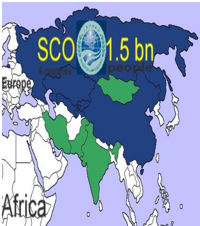
รูปที่ 5 จำนวนประชากรรวมของสมาชิก องค์การความร่วมมือเซี่ยงไฮ้

องค์การความร่วมมือเซี่ยงไฮ้ ถือกำเนิดเมื่อวันที่ 15 มิถุนายน พ.ศ.2544 โดยมีสมาชิก 6 ประเทศ คือ จีน รัสเซีย คาซัคสถาน คีร์กีซสถาน ทาจิกิสถาน อุซเบกิสถาน ซึ่งมีพื้นที่รวมกันถึง 30 ล้านตารางกิโลเมตร หรือคลุมพื้นที่ 3 ใน 5 ของยูเรเชีย มีประชากรรวมกัน 1,455 ล้านคน คิดเป็น 1 ใน 4 ของประชากรโลก เป็น การริเริ่มของจีน ที่ต้องการสร้างความไว้วางใจกันระหว่างชาติสมาชิก และลดกำลังรบที่ประจำอยู่ตามพรมแดนติดต่อกัน