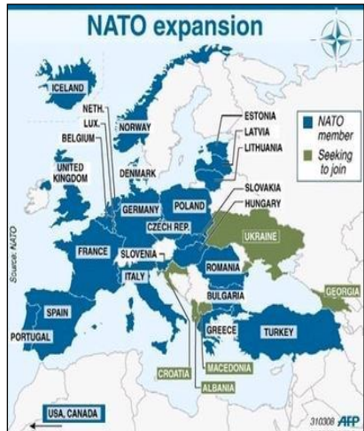
รูปที่ 3 ขนาดพื้นที่รวมของสมาชิกองค์การ นาโต