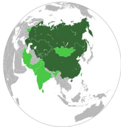
รูปที่ 6 ขนาดพื้นที่รวมของสมาชิก องค์การความร่วมมือเซี่ยงไฮ้

การที่จีนริเริ่มและให้ความสำคัญกับองค์การความร่วมมือเซี่ยงไฮ้มาก เพราะจีนมียุทธศาสตร์ที่จะฉีกกำลังกับรัสเซีย เป็นอีกกลุ่มหนึ่งเพื่อแสดงบทบาทต่อ การกำหนดชะตาของโลก เป็นการคานอำนาจสหรัฐและตะวันตก ลดการขัดแย้งกับ